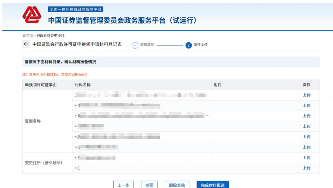
图-许可证申领领（材料清单）