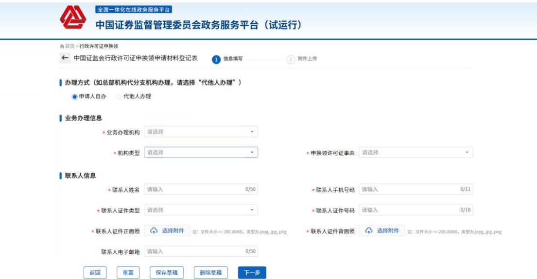
图-许可证申换领（信息填报）

申请人点击“申请许可证申换领”后，进入许可证申换领填报页面。申请人选择“办理方式”，填写申请信息点击“下一步”，并如图：