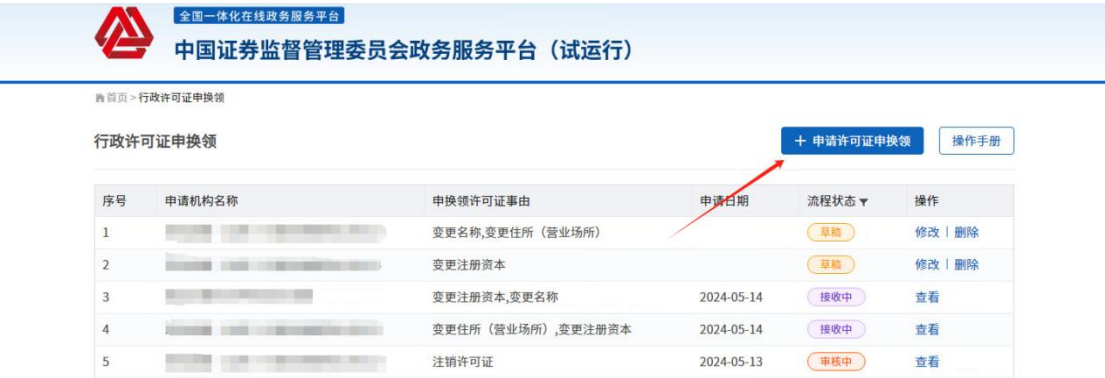
图-许可证申换领（事项列表）

在许可证申换领模块页面，显示该机构已申请的行政许可证申换领事项单据列表，点击“申请许可证申换领”按钮，可新增许可证申换领事项；点击“操作手册”按钮，可下载本操作手册。