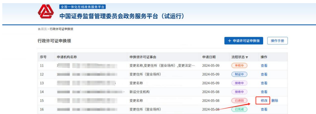
图-许可证申领领（已退回）

在行政许可证申领领列表，申请人可以查看许可证申领领的流程状态。对于监管人员审核退回的事项显示“已退回”，申请人可以再次点击“修改”，如图：